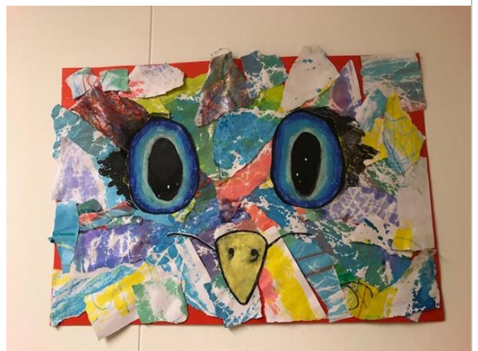
Animal collage van Lieve